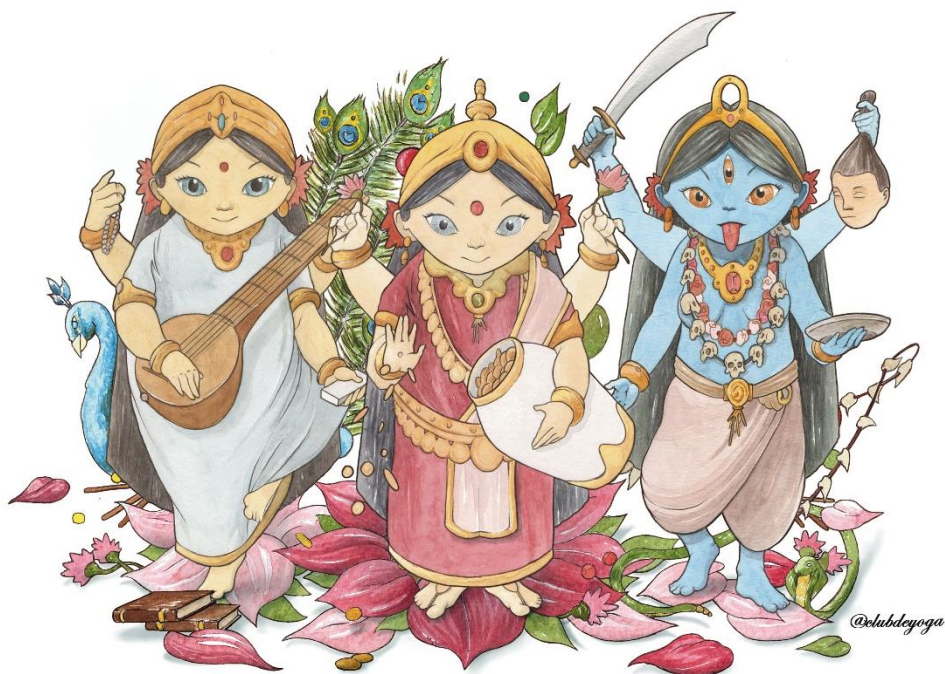
Saraswati, Lakshmi y Kali